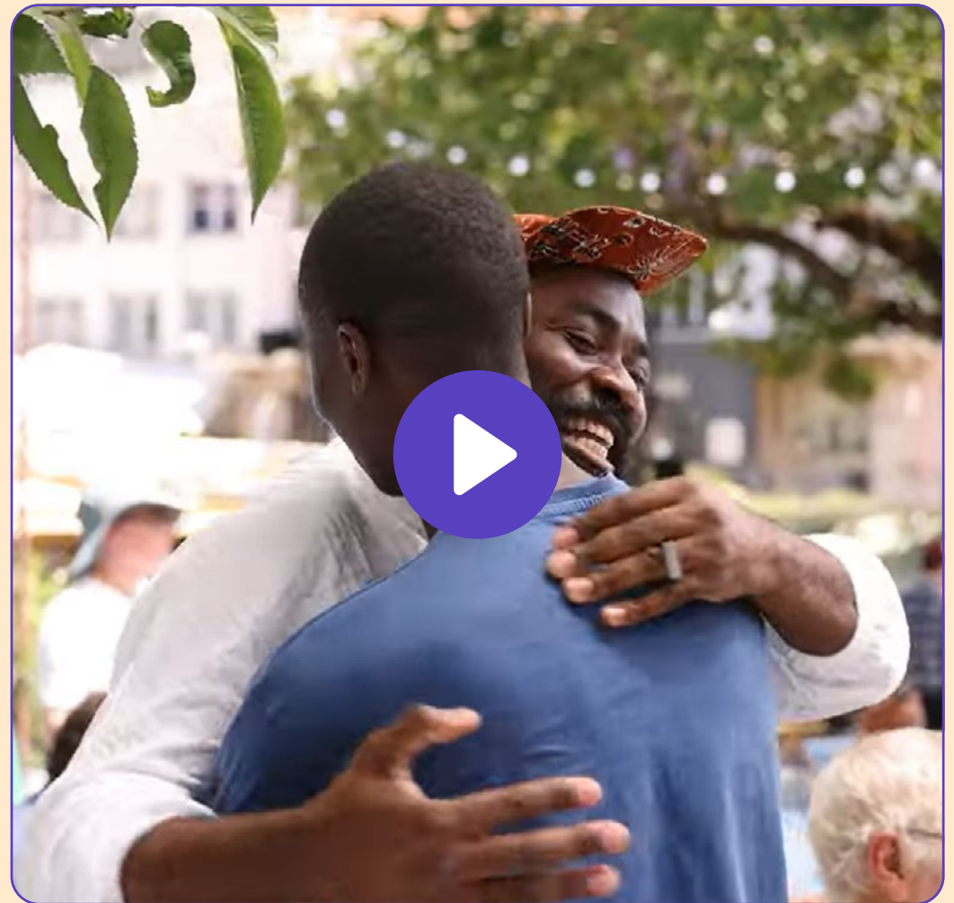
JazzUp – Jazz à Vienne 2023