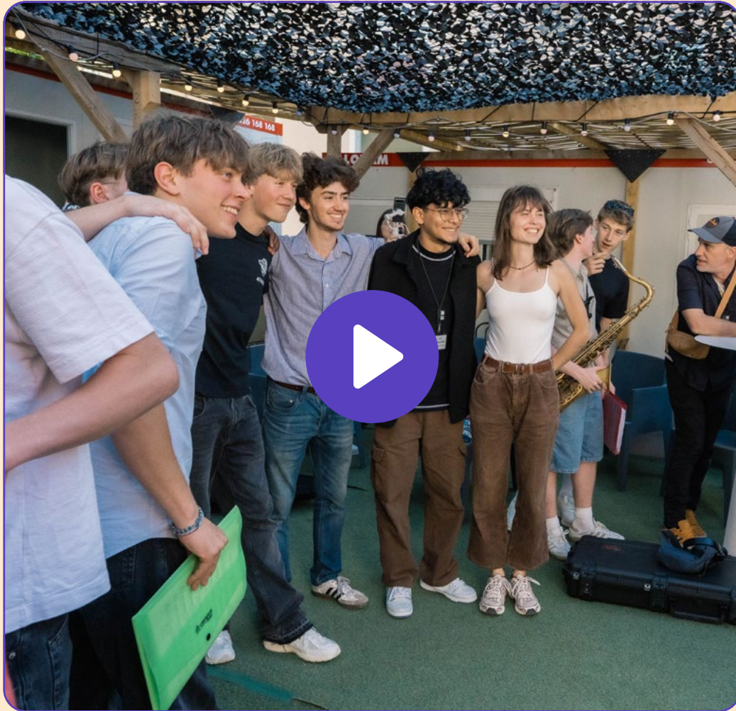
Zoom sur le JazzUp 2025