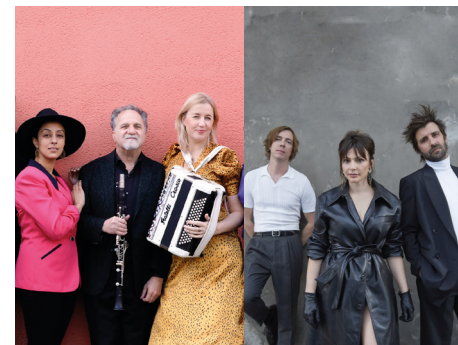
© R. Hostekind – © Y. Nivault