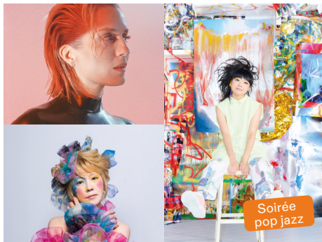
© C. Vivier – © S. Yull Nah – © M. Nishimura